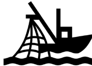
Created by Luis Prado from Noun Project