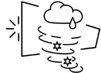
Created by Olena Panasovska from Noun Project

However, as recommended by countries during the 1 st Regional Consultation Meeting, the mandate of the permanent Coordination Mechanism is proposed to be thematically broader including sectors and economic activities that are related to the marine environment and resources, such as Tourism, Oil and Gas, Shipping, Mining, Biotechnology, Bioprospecting and Renewable Energy .