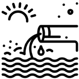
Created by priyanka from Noun Project

Thematic scope: The mandate will at least initially cover the three main thematic areas identified in the CLME+ SAP – marine pollution, marine biodiversity and fisheries , and the cross-cutting area of climate change .