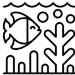
Created by Made by Made from Noun Project