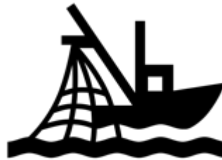
Created by Luis Prado from Noun Project