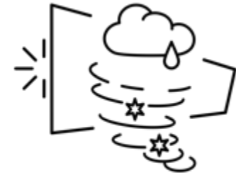
Created by Olena Panasovska from Noun Project

Sin embargo, por recomendación de los Estados durante la 1ª Reunión Consultiva Regional, se propone que el mandato del Mecanismo de Coordinación permanente se amplíe para cubrir otras áreas temáticas, sectores y actividades empresariales relacionadas con el medio ambiente y los recursos marinos, tales como: turismo, gas y petróleo, barcos, minería, biotecnología, bioprospección y energías renovables .